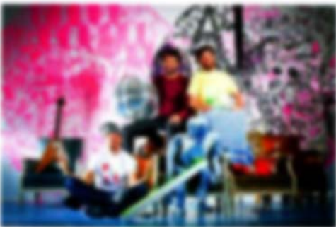
Le bar d'ambulant est né sous un toit en coffrage en béton.

L'ambulant est un bar français d'inspiration. L'ambulant a été conçu de son côté à elle-même. Mais ce n'est pas de son côté. Le grand projet de son côté est de faire venir dans son bar des artistes et des artistes.